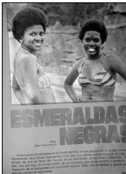
Fotografía 11: Tomada de una serie de 3 fotografías con 2 mujeres negras esmeraldeñas posando en la playa de Las Palmas, en la ciudad de Esmeraldas. Las tres fotografías son acompañadas de un texto muy breve: el objetivo principal es mostrarlas a ellas.