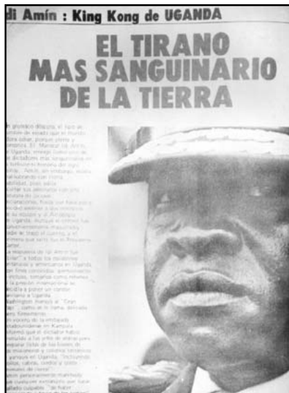
Fotografía 5: La fascinación de Vistazo para los dictadores africanos. Idi Amin Dada en el número de abril de 1977: p.38