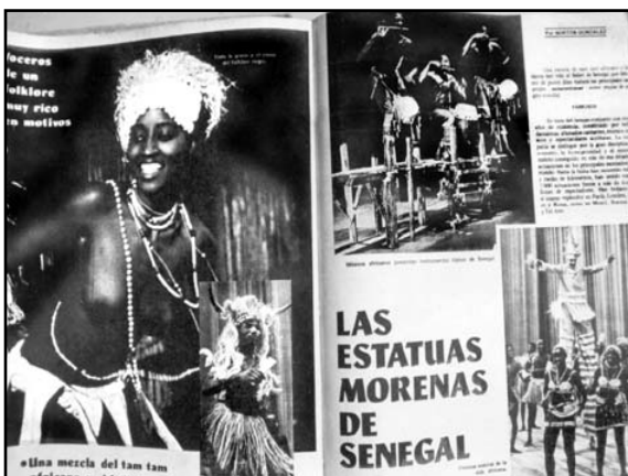
Fotografía 9: Bailarinas del Ballet Nacional de Senegal (No. 194, julio de 1973: p. 80-81).