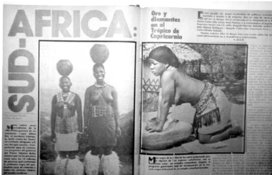
Fotografía 8: Tomada de un artículo sobre Africa del Sur (febrero de 1981: p. 58-59).