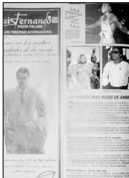
Fotografía 21: “Los negros más ricos de América”; uno de los numerosos artículos con este tema en los años 1980.