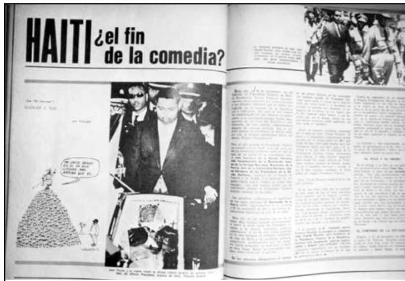
Fotografía 27: Tomada de un artículo del número 169 de junio de 1971: p. 116-117.