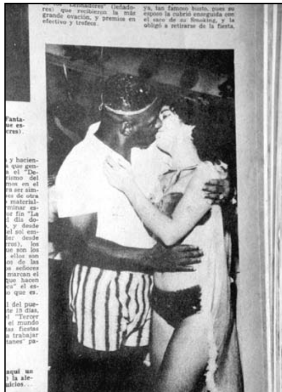
Fotografía 24: Tomada de un artículo publicado en el número 22, de febrero de 1959: p.5.

una mujer negra, sería seguramente menos sensacional. La historia de relaciones raciales en contextos coloniales y neocoloniales en las Américas, así como en Africa, esta llena de tales casos que expresan nada más que el poder de las elites socio-económicas y políticas. Para continuar con el tema, la segunda fotografía sigue el orden 'natural' de las cosas y, por lo tanto, es menos subversiva que la precedente: representa a un hombre blanco y vestido -un sacerdote anglicano- dominando, al menos con la mirada, a una mujer negra desnuda que apenas tiene un pedacito de tela sobre los muslos. El lector la puede ver de espaldas con el trasero descubierto. El artículo está titulado: "El sacerdote que pinta desnudos" y cuenta la historia de un sacerdote anglicano que tiene pasión por pintar mujeres desnudas.