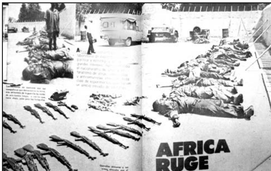
Fotografía 7: Tomada de un artículo sobre la guerra civil en Zimbabwe (ex-Rodhesia) (junio de 1977: p. 72-73).