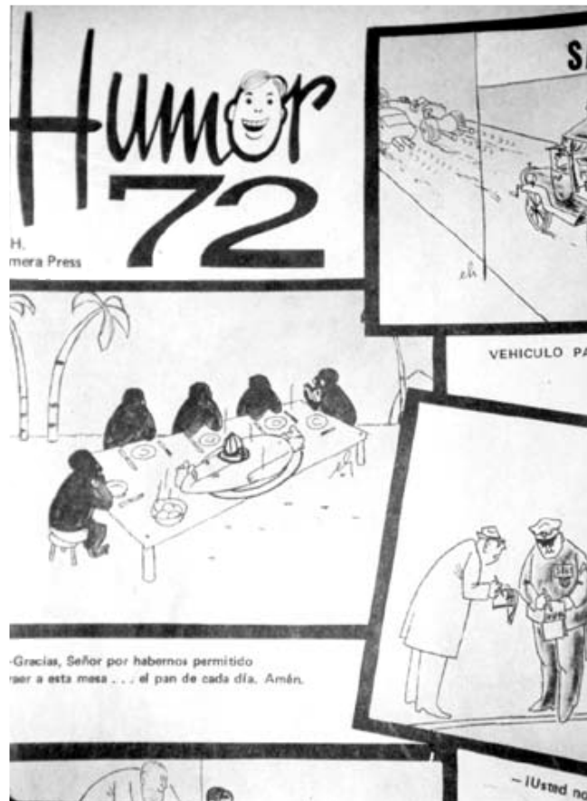
Fotografía 4: Julio de 1972, No. 82: p. 138. La leyenda dice: “Gracias, señor por habernos permitido traer a esta mesa... el pan de cada día. Amén.”