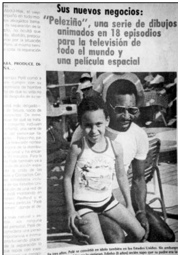
Fotografía 22:

tando su trasero contra la pelvis de su compañero bailarín, que podemos ver bailando detrás de ella. La fotografía fue tomada durante un carnaval en Trinidad. Entre otros artículos y fotografías que van en la misma dirección, se puede también hacer referencia a un texto publicado el 5 de septiembre de 1986: 83-85, que está dedicado a Miss Brasil 1986. A veces, el periodista la llama “la bella mulata”. Otras veces utiliza frases dramáticas como “el sueño de la cenicienta negra”. Muchas de las fotografías la muestran en traje de baño. La última foto viene con la leyenda: “Gesto de ensoñación, magia y pasiones desbordadas. Miss Brasil es un poema del mulataje”.