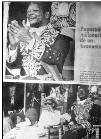
Fotografía 6: Otro dictador africano que tuvo mucha cobertura en Vistazo: Jean Bédel Bokassa de la República Centro-Africana (20 de enero de 1978: p. 31