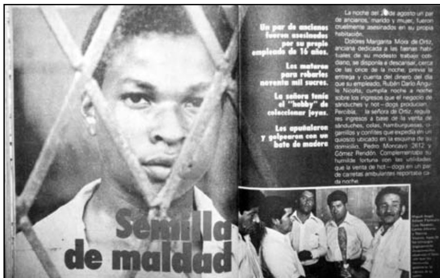
Fotografía 17: