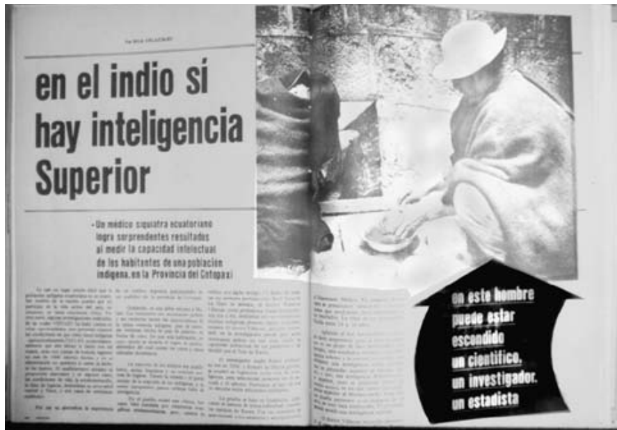
Fotografía 1: Enero de 1972: p.100-101

Estas representaciones de gente indígena son marcadas por el contraste que se hace, desde una perspectiva blanca-mestiza dominante, con las imágenes de personas blancas nacionales, norteamericanas y europeas. Al contrario de aquellas, estas evocan a seres civilizados, modernos y respetables. Las características de sus cuerpos definen lo que se considera bello, atractivo, deseable, ilustrando la ideología del blanqueamiento. Como argumenta Norman Whitten, 'blanqueamiento' no quiere decir que el blanco se 'indianiza' o 'aindia', sino al contrario, es el indio quién debe blanquearse cultural y físicamente. En cuanto a los negros, ellos no hacen parte de la química nacionalista. Ni son considerados como uno de los ingredientes del mestizaje oficial. En lugar de ser simplemente invisibles, como se ha argumentado numerosas veces en el pasado, ellos más bien son contruidos, ideológicamente, a través de sus representaciones, como los 'últimos otros'.