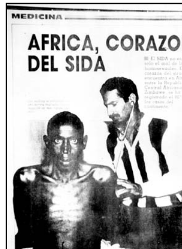
Fotografía 10: Número del 27 de marzo de 1987: p. 60.