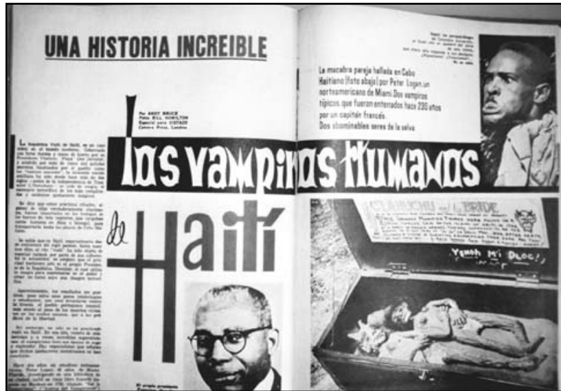
Fotografía 26: Tomada de un artículo publicado en el número 162 de noviembre de 1970: p. 88-89.