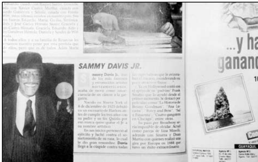
Fotografía 20: Uno de los varios artículos dedicados a Sammy Davis Jr. en los años 1970.