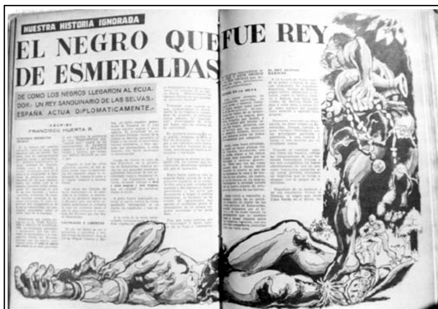
Fotografía 15: Tomada de un artículo sobre la llegada del grupo de Sebastián Alonso de Illescas en Esmeraldas (número de octubre de 1959: p. 72-73).

Los ejemplos de este tipo de representaciones siguen a lo largo de la historia de la revista. En 1961, la bestialidad de un prisionero negro está enfatizada por la presencia, al lado de su fotografía, de la siguiente leyenda: “¡Si salgo vuelvo a matar!” (Julio de 1961: 53-54). Esta historia de denigración entusiasta de los hombres negros, que cuando no los presenta como delincuentes ‘naturales’ o animales salvajes que no pueden controlar sus impulsos, los presenta como otro tipo de problema social: madres adolescentes, pobres sin educación, ‘hombres ratas’, etc., llega hasta el presente. En el año 1997, Vistazo festejó sus 40 años de existencia con un número especial. En este número presenta entrevistas a varias personas que cumplieron 40 años de edad en el año 1997. Así uno puede leer entrevistas de un policía, de un médico, de un abogado, de una secretaria, de un pescador, etc. En la página 118 del N° 715 del 5 de junio de 1997, se presenta la entrevista y la fotografía de “El Delincuente”: un afro-esmeraldeño que lleva, dice la leyenda, 20 años en la delincuencia y 16 preso.