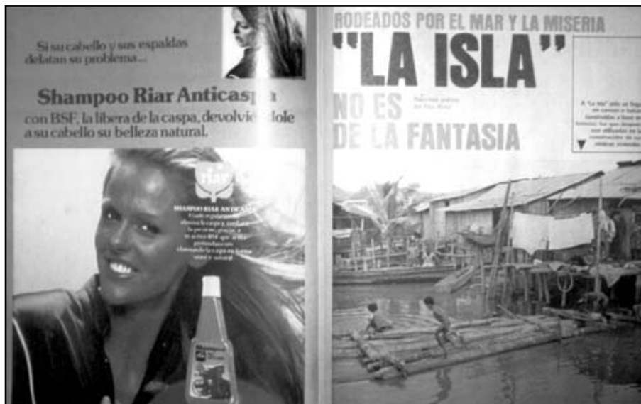
Fotografía 19: Interesante contraste entre el refinamiento urbano (blanco) por un lado, y la miseria negra del barrio pobre llamado "la Isla Piedad" en la ciudad de Esmeraldas. (4 de julio de 1980: 22-23).