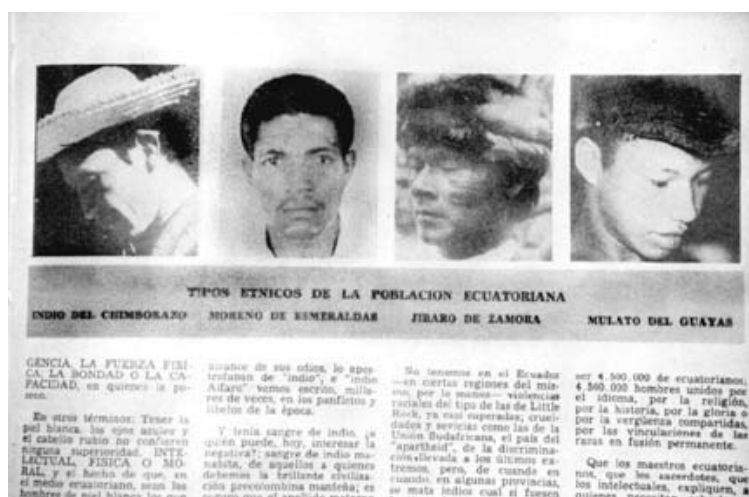
Fotografías 2 y 3: Tomadas de un artículo sobre el censo de 1962, titulado "¿Cuántos Somos y Quiénes Somos?" (No. 68, enero de 1963: 71-73). La fotografía 2, contrasta con la fotografía 3 por el hecho de que los "mestizos geniales" sí tienen nombres cuando los "tipos étnicos de la población ecuatoriana" (para el periodista esto quiere decir "no-mestizo y no genial") no tienen