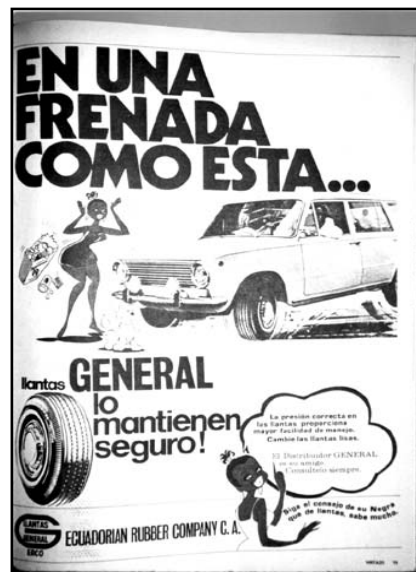
Fotografía 12: Representación caricatural de una mujer negra en una publicidad para llantas. Esta publicidad era muy común en los años 1970 en Vistazo. En muchas ocasiones, al contrario del contenido de la presente fotografía, las llantas son llamadas "negras" en los textos de estas publicidades. Estas publicidades constituyen una de las pocas representaciones de mujeres negras en contexto urbano en Vistazo antes del inicio de los años 1990.