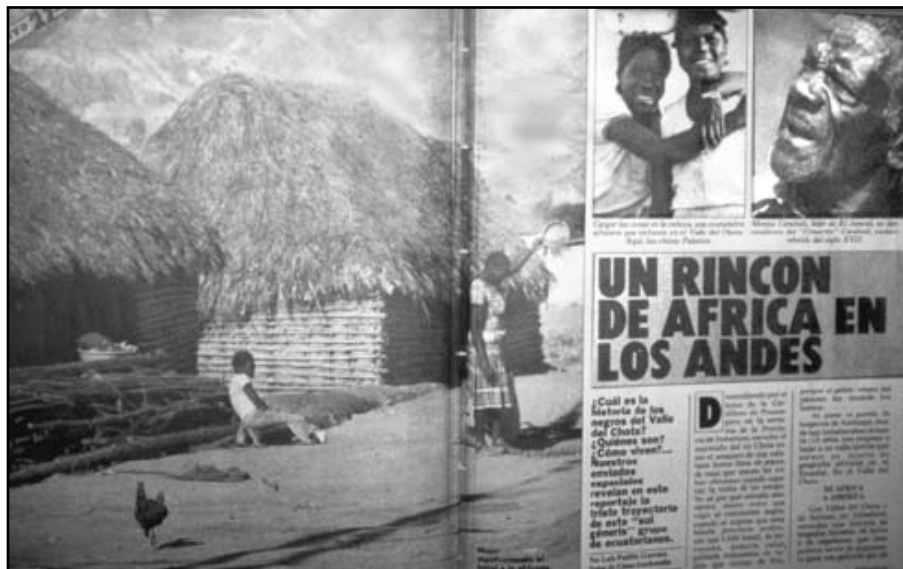
Fotografía 18: